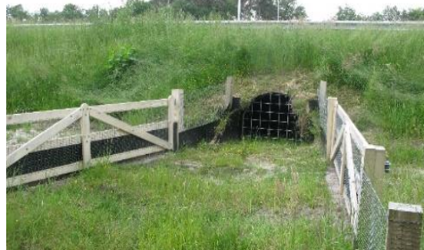
Afbeelding 4 Faunatunnel A12 Maarsbergen

Als op de betreffende locatie geen van de typen met de hoogste prioriteit gerealiseerd kan worden, wordt bekeken of een type met een andere prioriteit uit Tabel 1 of kaart 4 mogelijk is. Wat wel of niet mogelijk is op een locatie wordt in de eerste plaats bepaald door de abiotische omstandigheden en de mogelijkheden om deze te verbeteren. Daarbij gaat het bijvoorbeeld om de fosfaatgehalten van de bodem en de hydrologische situatie. Daarnaast speelt de landschappelijke en cultuurhistorische situatie een rol. Daarbij is van belang dat de gebieden niet geheel éénvormig zijn: het voornamelijk natte deelgebied Noorderpark bijvoorbeeld, bevat ook de drogere overgang naar de Utrechtse Heuvelrug, waar de categorie natuurakkers één van de natuurdoelen is. Ook combinaties met andere doelen, zoals waterberging en recreatie, kunnen leiden tot natuur met een lagere prioriteit. Zo zal de combinatie met waterberging mogelijk niet kunnen leiden tot nat schraalland, maar wel tot vochtig hooiland.