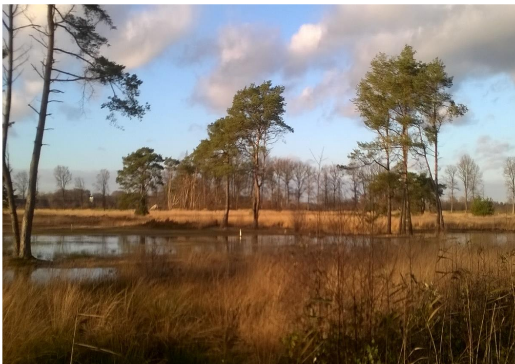
Afbeelding 2 Natuurgebied Groot zandbrink

Provincies hebben midden 2023 een 1e versie van hun gebiedsprogramma ingediend bij het Rijk. Deze 1e versie wordt getoetst door de Ecologische Autoriteit. Naar verwachting komen de definitieve gebiedsprogramma's in 2024/2025 gereed. De gebiedsprogramma's kunnen vervolgens ook doorwerken naar ontwikkeling en beheer van het Natuurnetwerk Nederland en van de Agrarische leefgebieden en Categorieën, zoals begrensd in de provinciale Natuurbeheerplannen.