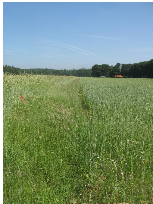
Afbeelding 8 Graanakker kruiden bij Elst