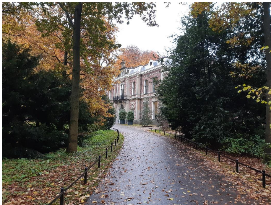
Afbeelding 9 Oostbroek

Op Kaart 3. Bijdragen staat voor welke gebieden de verschillende bijdragen kunnen worden aangevraagd. In de verordening kunnen nadere regels gesteld zijn aan de bijdragen.