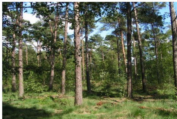
Afbeelding 5 Beheertype droog productiebos op de Utrechtse Heuvelrug

Voor de kwaliteitsverbetering van bestaande natuur binnen natuurterreinen met grondwaterafhankelijke beheertypen is de hydrologie een belangrijke randvoorwaarde. Voor het treffen van antiverdrogingsmaatregelen ten behoeve van natuurterreinen die negatief beïnvloed worden door grondwateronttrekkingen, is een inrichtingssubsidie op basis van de SKNL mogelijk. Hierbij wordt voor de subsidieverlening getoetst of er sprake is van negatieve invloed van vergunde onttrekkingen voor zowel drinkwater als industrie.