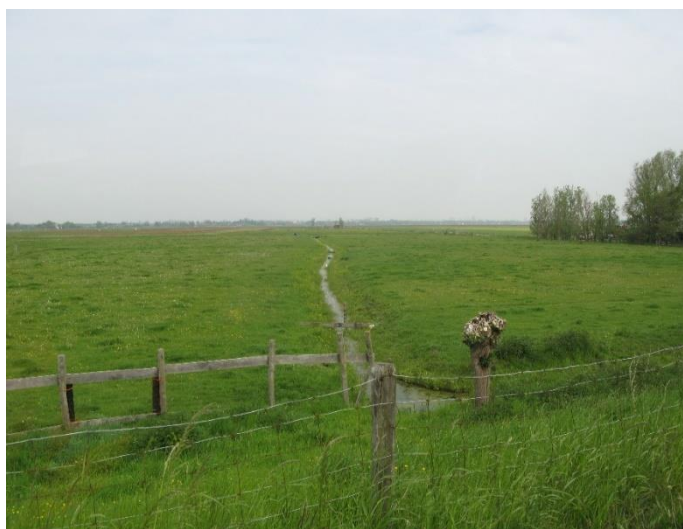
Afbeelding 7 Weidevogelgebied De Ronde Hoep