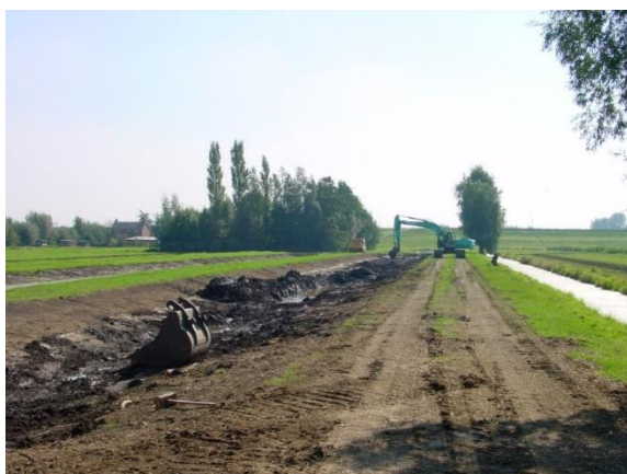
Afbeelding 10 Natuurinrichting Lopikerwaard

Deze subsidie vergoedt de waardedaling voor het veranderen van landbouwgrond naar natuurgrond. Hiervoor komen eigenaren of erfpachters in aanmerking van percelen die op kaart 1 zijn aangegeven als 'Te ontwikkelen natuur', 'Te ontwikkelen natuur zoekgebied (groene contour)' of 'Te ontwikkelen natuur zoekgebied (NNN)'. De subsidie functieverandering wordt alleen verstrekt als de terreinen worden ingericht voor de natuurdoelen die voor het betreffende gebied zijn vastgelegd in Tabel 1 of kaart 4. Om een zo hoog mogelijke natuurkwaliteit te krijgen zal de provincie daarbij nadrukkelijk aansturen op realisatie van de natuurtypen met prioriteiten 1 en 2 met uitzondering van de zoekgebieden bos buiten NNN.