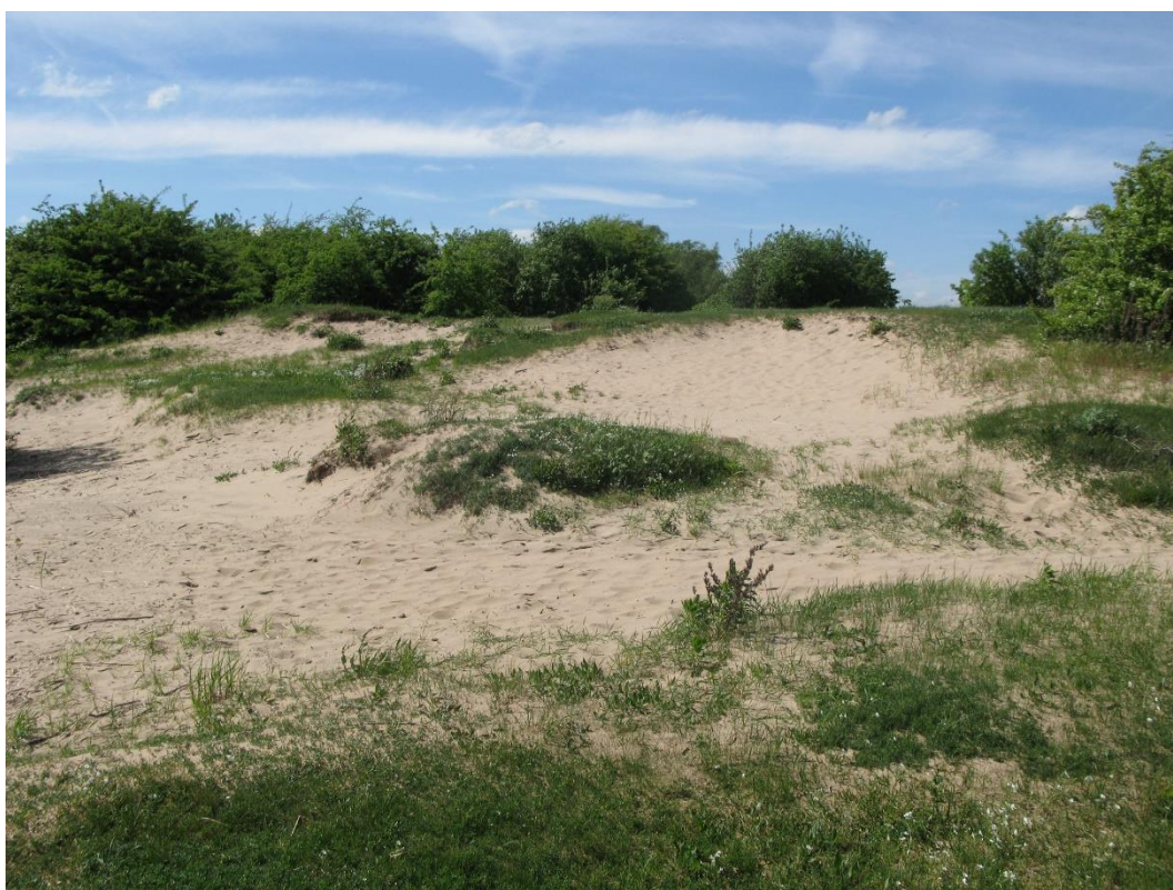
Afbeelding 1 Rivierduinen bij uiterwaarden De Bol

In hoofdstuk 4 worden de natuur- en landschapsdoelen voor de natuurgebieden en het agrarische natuur- en landschapsbeheer van de provincie nader toegelicht. In Tabel 1 zijn de prioriteiten van kaart 4 Ambitiekaart opgenomen. In Tabel 2 staat aangegeven welke doelsoorten in welke leefgebieden en categorieën beschermd moeten worden. In paragraaf 4.5 staan de beoordelingscriteria waarop de RVO, Rijksdienst voor Ondernemend Nederland, de gebiedsaanvragen van de ANLb-subsidie toetst. In Bijlage 1 zijn uitgebreide gebiedsbeschrijvingen opgenomen.