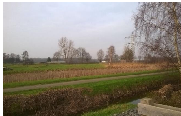
Afbeelding 3 Gagelbos Ruigenhoek Noorderpark in De Bilt

In de Index Natuur en Landschap is elk beheertype nader omschreven, zoals een algemene beschrijving van het beheertype en de specifieke kenmerken van het beheertype waardoor het zich onderscheidt van andere beheertypes. Niet alle (beheer)typen uit de index zijn te vinden in de provincie Utrecht.