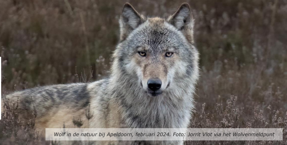
Wolf in de natuur bij Apeldoorn, februari 2024.